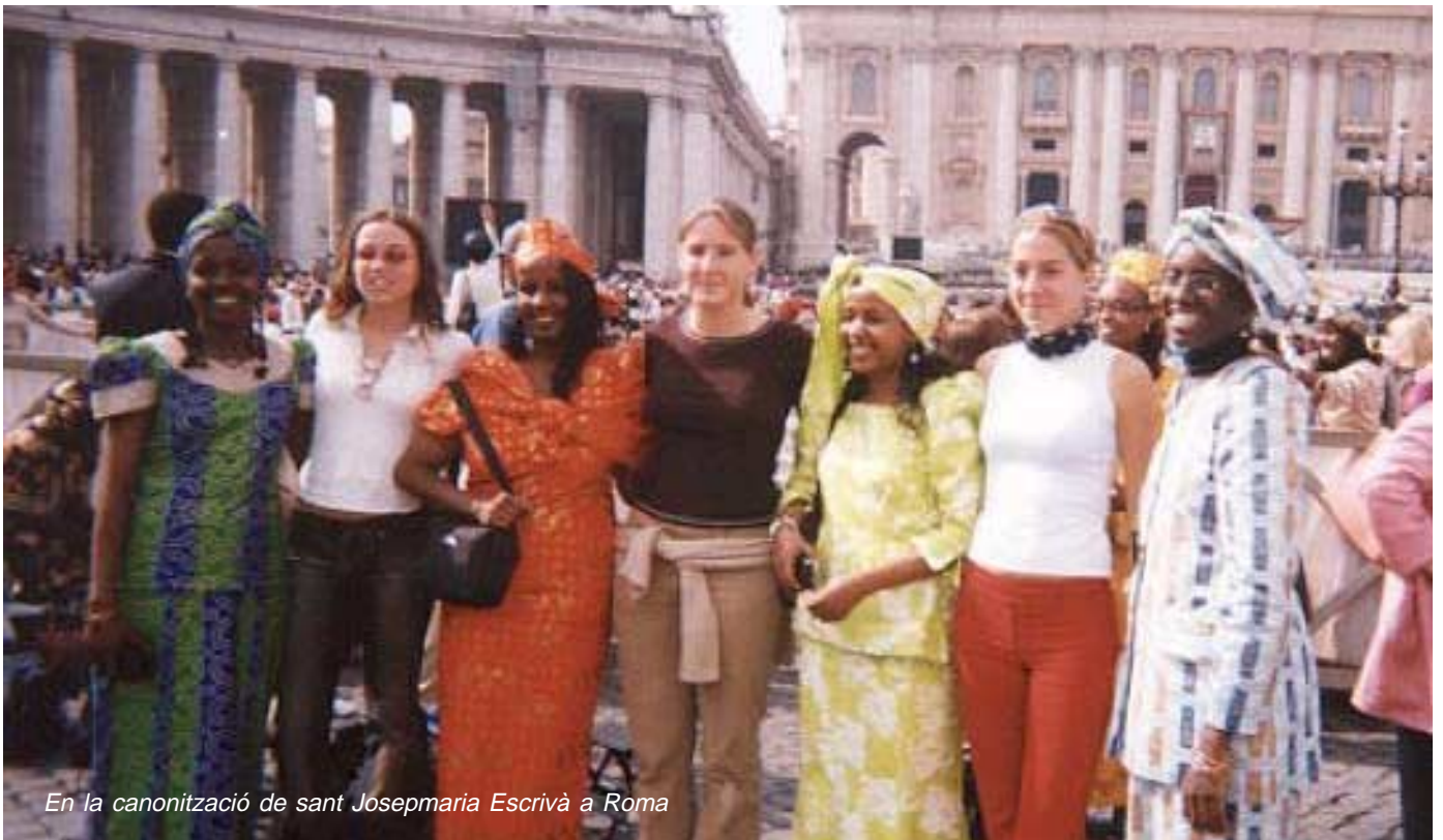
En la canonització de sant Josepmaria Escriva a Roma

Un nombrós grup d'alumnes i professors de Camp Joliu van assistir el passat mes d'octubre a Roma a la canonització de Sant Josepmaria Escriva , qui va impulsar directament iniciatives de caire educatiu i assistencial arreu del món. Podem descobrir moltes de les seves ensenyances plasmades de manera pràctica en els trets que considerem característics del nostre estil educatiu.