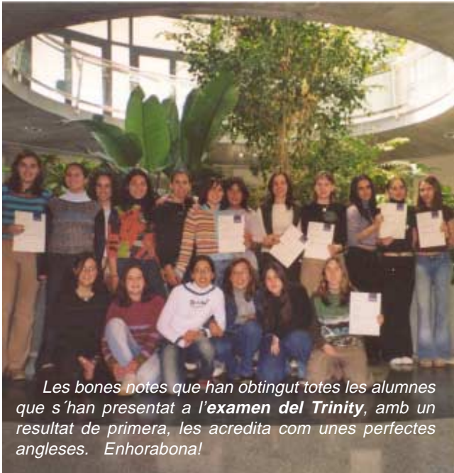
Les bones notes que han obtingut totes les alumnes que s'han presentat a l'examen del Trinity, amb un resultat de primera, les acredita com unes perfectes angleses. Enhorabona!

La convivència d'estudis a Can Soteres va ser una bona experiència per a preparar la superació del curs i de la selectivitat, fites immediates a aconseguir per les alumnes, aprofitant molt les hores d'estudi i participant activament en les activitats proposades a totes les classes. Tant professores com alumnes van gaudir d'un ambient relaxat i de gran companyerisme.